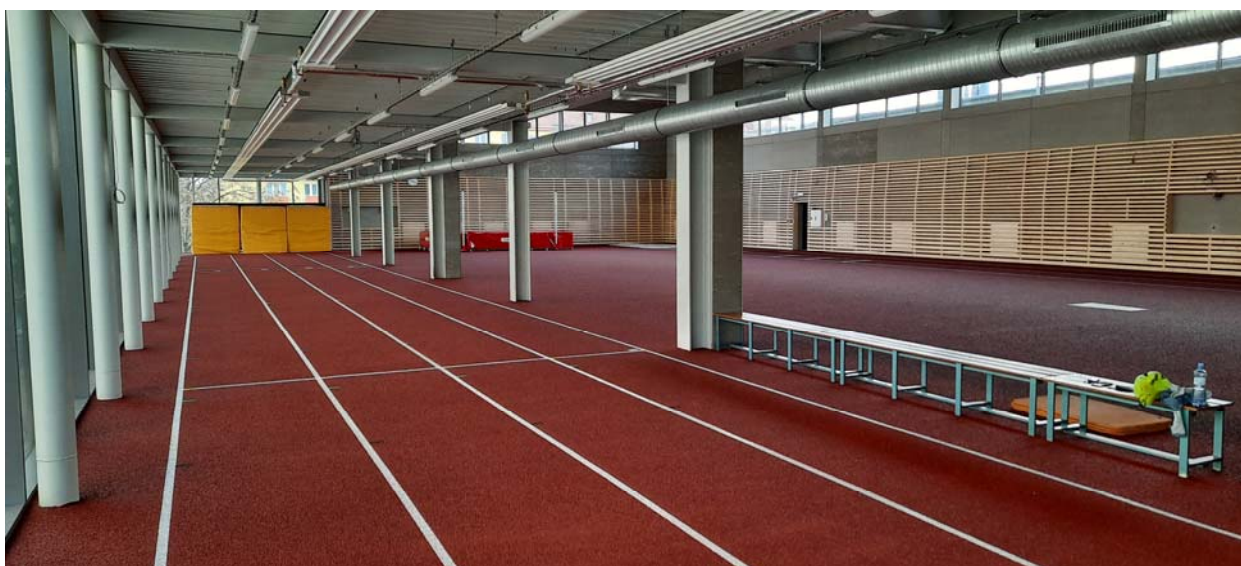
Atletická hala v Areálu sportovních nadějí