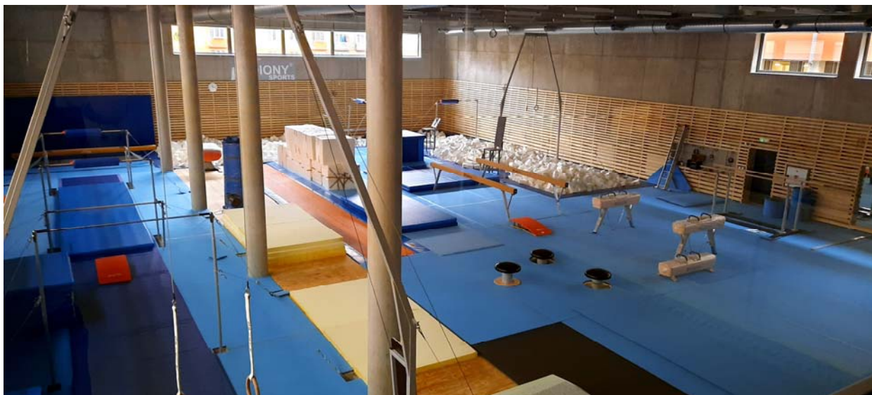
Gymnastická hala v Areálu sportovních nadějí